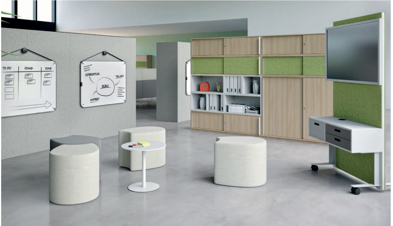
CEKA-Produkte auf den Abbildungen: mobile Medienwand CrossMeet-Connect, Multifunktions-tisch Turn4, CrossBox S, CrossMeet Hocker mit Lifttisch, Stauraum-möbel CombiNeo, Raumgliederungssystem Clix