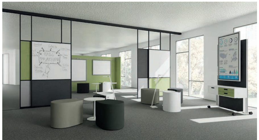
CEKA-Produkte auf den Abbildungen: CrossMeet Hocker, Lifttisch, mobile Medienwand CrossMeet-Connect, Raumgliederung FlexsWall und Clixs

Für detaillierte Informationen zur Produktfamilie CrossMeet kontaktieren Sie uns gerne.–