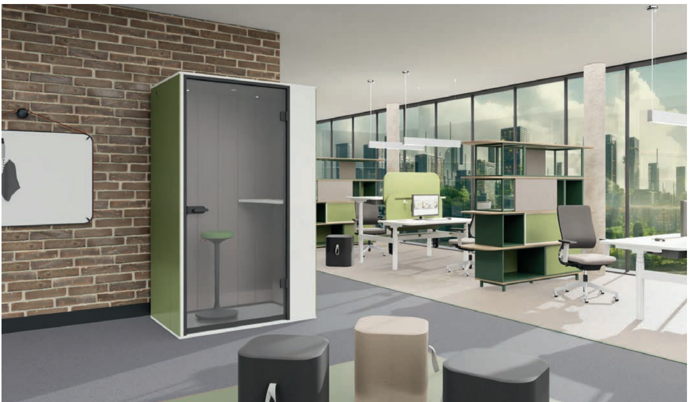
CEKA-Produkte auf den Abbildungen: ClixsBox, modulares Wandsystem Clixs, Raumsystem Ways, Styles-Bench